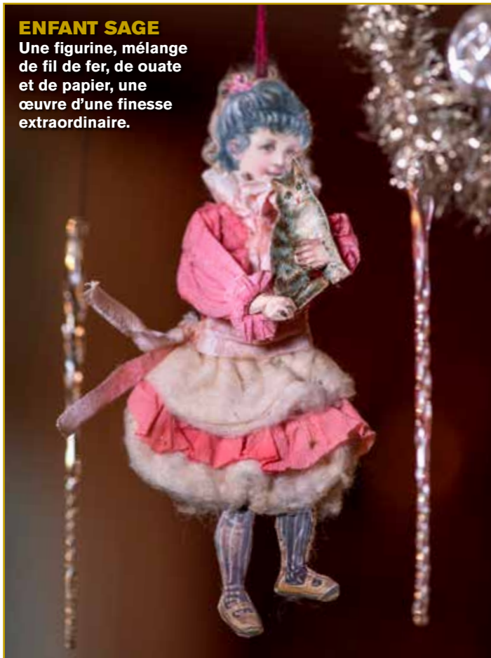
ENFANT SAGE Une figurine, mélange de fil de fer, de ouate et de papier, une œuvre d'une finesse extraordinaire.