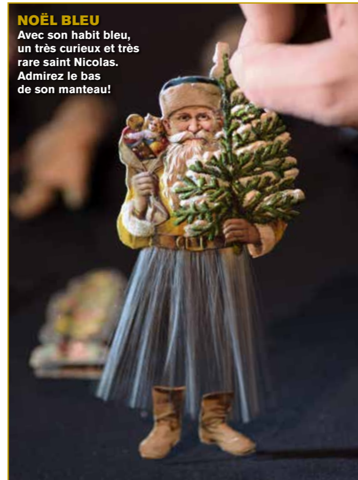
NOËL BLEU Avec son habit bleu, un très curieux et très rare saint Nicolas. Admirez le bas de son manteau!