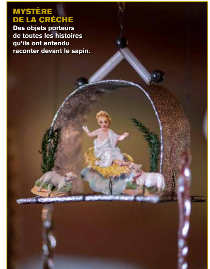
MYSTÈRE DE LA CRÈCHE Des objets porteurs de toutes les histoires qu'ils ont entendu raconter devant le sapin.