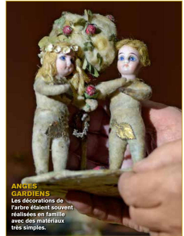
ANGES GARDIENS Les décorations de l'arbre étaient souvent réalisées en famille avec des matériaux très simples.