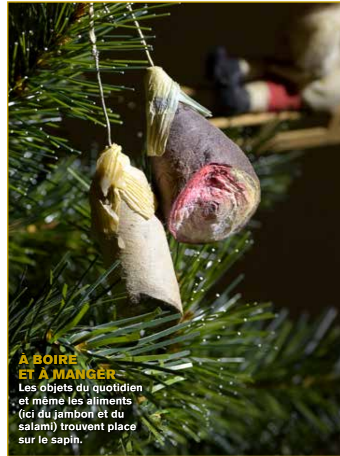
À BOIRE ET À MANGER Les objets du quotidien et même les aliments (ici du jambon et du salami) trouvent place sur le sapin.