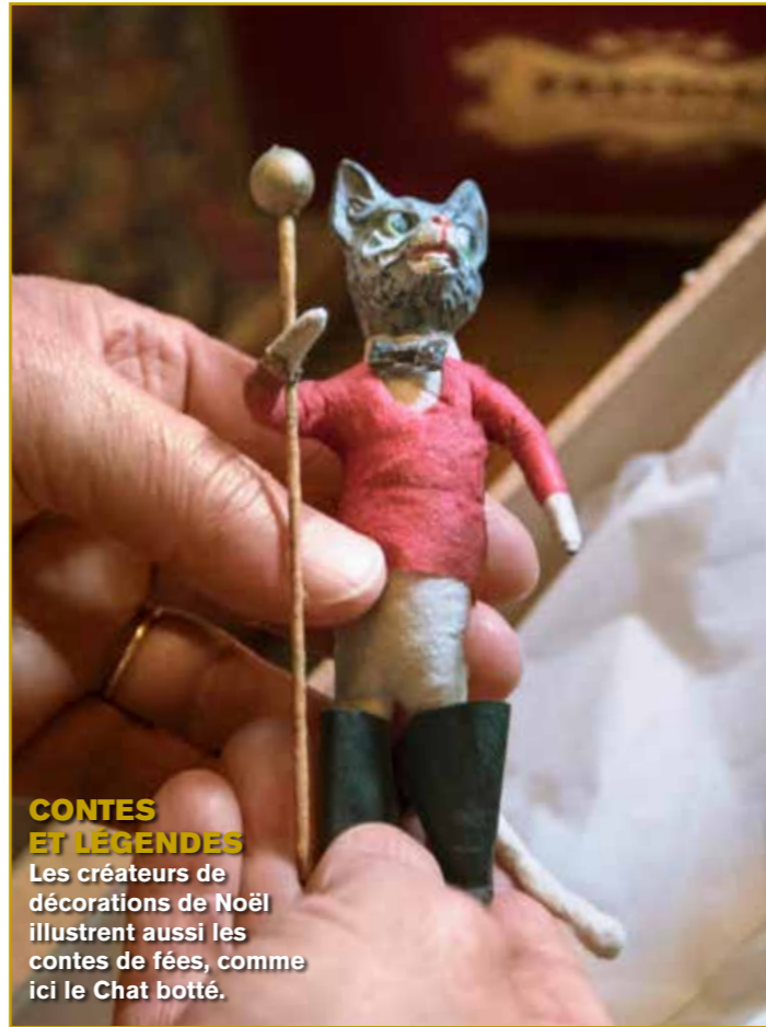
CONTES ET LÉGENDES Les créateurs de décorations de Noël illustrent aussi les contes de fées, comme ici le Chat botté.