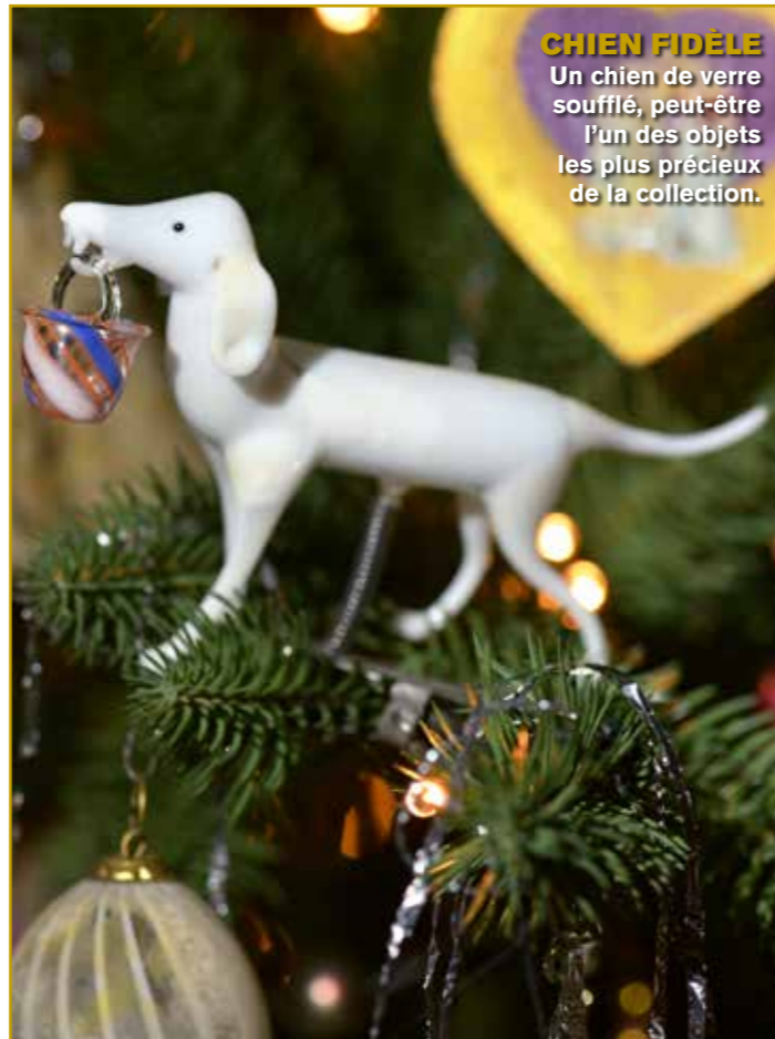
CHIEN FIDÈLE Un chien de verre soufflé, peut-être l'un des objets les plus précieux de la collection.