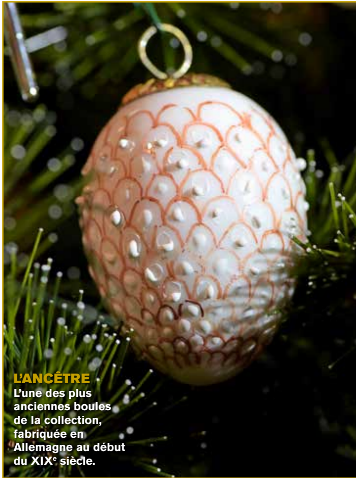
L'ANCÊTRE L'une des plus anciennes boules de la collection, fabriquée en Allemagne au début du XIX e siècle.